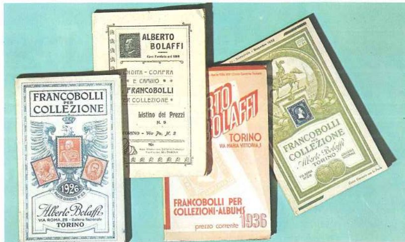
Los precursores de las modernas ediciones filatélicas son los antiguos boletines comerciales, que presentaban a los clientes las listas de los sellos que estaban a la venta.

Los libros de divulgación son atractivos, están bien impresos y mejor ilustrados y, en general, no resultan demasiado caros. En cambio, los precios se elevan en el campo de los manuales especializados. Cada uno de éstos se dirige a un público lector relativamente limitado, de modo que su tirada es reducida y los costes de producción se han de dividir por un número poco elevado de ejemplares. Pero si el sector del coleccionismo que se haya preferido constituye, por fortuna, el objeto de una operación especializada, no hay que dudar en procurarse un libro, ya que en él se encontrarán noticias que de ninguna otra forma se podrían obtener; en los libros se adquieren conocimientos que no es posible conseguir de otro modo, se encuentran elementos de juicio para superar los problemas de identificación que pueden llegar a desanimarnos, y con todos esos apoyos